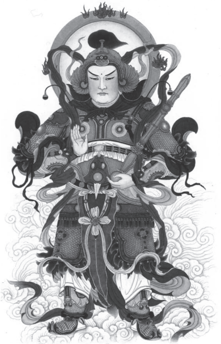
南無護法韋馱天尊菩薩