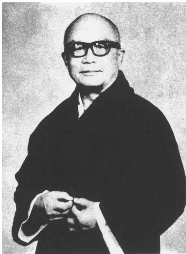
影 近 者 作