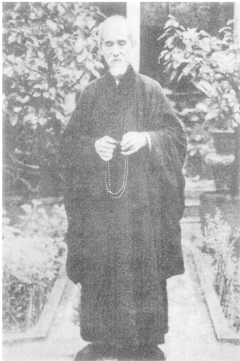
相 法 尚 和 老 雲 虛