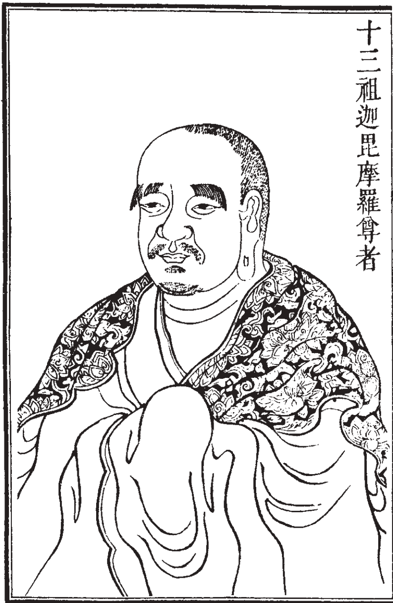
十三祖迦毘摩羅尊者