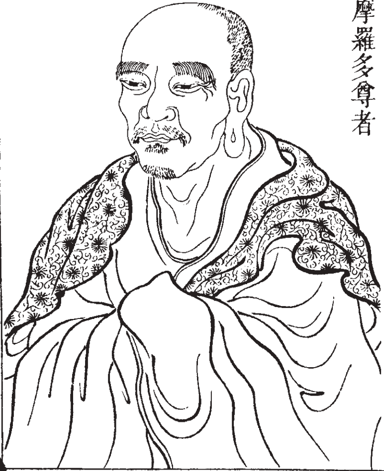
十九祖鳩摩羅多尊者