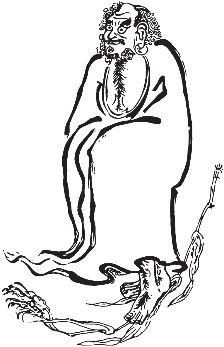
少林寺 明代《達摩祖師一葦渡江圖》原碑拓本