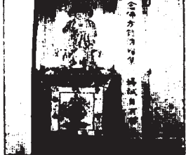
台灣高雄地方法院室內布置，一個小佛堂。

因僧人的積極勸導，司法官出家的消息便在司法界傳，不過近年來司法體系內部修持，已成一股風氣。台灣地方法院第一廳，就設了一個專修佛法的小佛堂，每周四中午，司法院、台灣高等法院、高雄地方法院人員集會，即在佛堂念佛共修。本身也屬佛教的刑任法官。